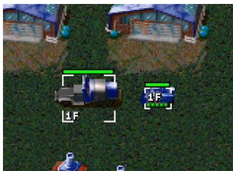
Оба юнита в Построении 1