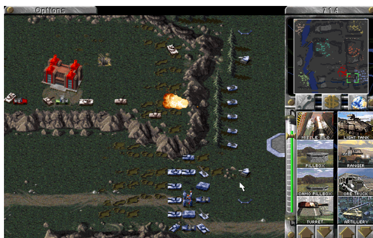
САУ ведут огонь с закрытых позиций

Если вы планируете использовать САУ для обороны, вам помогут следующие меры